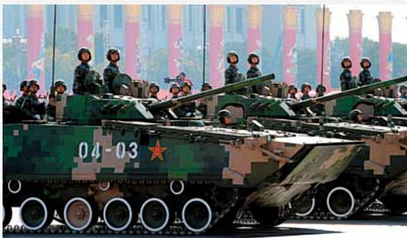
新型履带式步兵战车

第二炮兵是中国战略威慑的核心力量，主要担负遏制他国对中国使用核武器、遂行核反击和常规导弹精确打击任务，由核导弹部队、常规导弹部队、作战保障部队等组成。