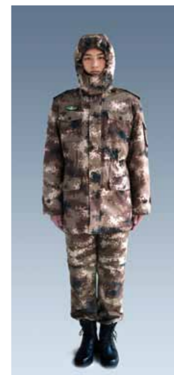
陆军冬季迷彩作训大衣