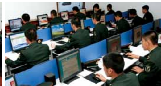
利用多媒体平台延伸教育课堂