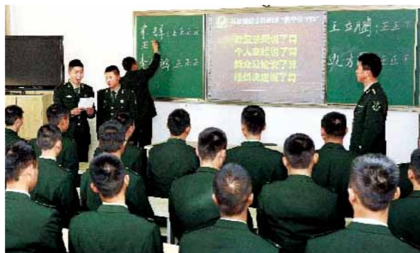
选取士官连队民主测评会

(5) 具有全日制大专以上学历的士兵考入士官学校后，可参加高技能人才培养班，修满规定课程和学分的，发给职业技术教育本科毕业证书和学位证书；毕业后原则上服役至四级军士长，获得技师资格的，优先选取为高级士官。