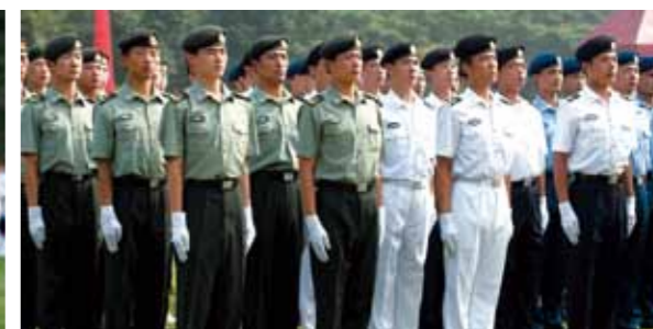
身穿夏常服的士兵