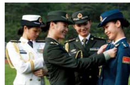
试穿军服的女军官

武警警服包括：春秋常服为橄榄绿色，夏常服为浅橄榄绿色，冬常服为深橄榄绿色，作训服为通用迷彩和数码荒漠迷彩。